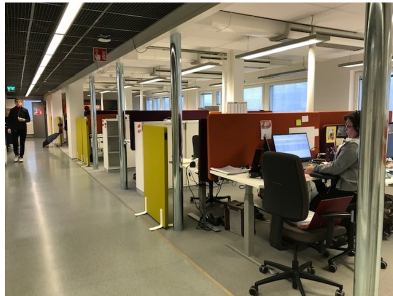
Celian henkilökunta, n. 40 henkeä, työskentelee monitilatoimistossa (vuonna 2020 -2021 pääosin etänä)