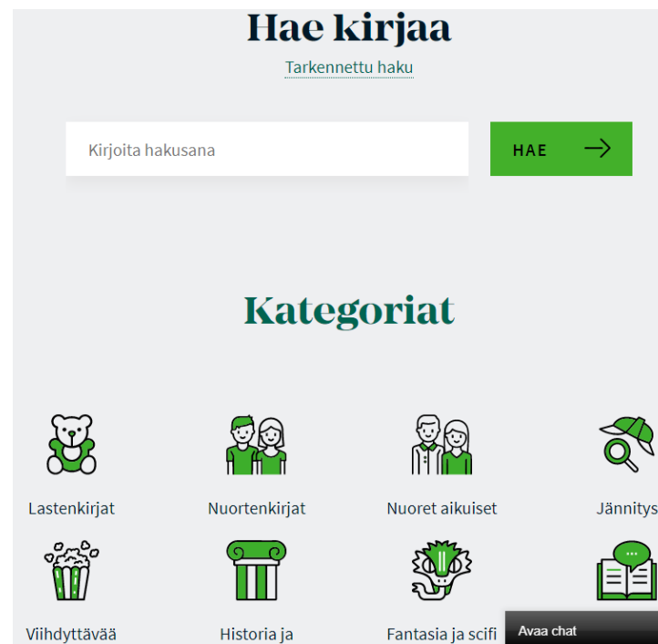
Näkymä Celianetin etusivulta